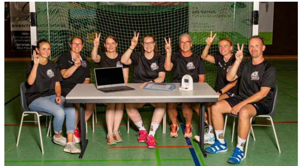
Unsere Zeitnehmer & Sekretäre